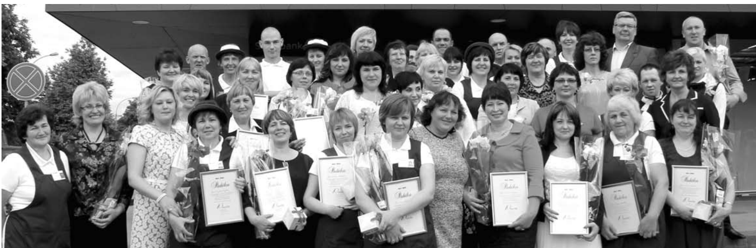
Jubiliejaus proga – nuotrauka ant prekybos centro laiptų.

Nuomonė. Seimo Pirmininkė „darbietė“ Loreta Graužinienė mano, kad vadinamasis Prezidentės „juodasis sąrašas“ yra nepagrįstas. „Na, jų (faktų - ELTA) tiesiog nėra. Jeigu ministrai iš atitinkamų struktūrų, kur jos pagal įstatymą turi teikti tą informaciją, ir jinai bus rimta, net neabejoju, kad ministrai labai greitai priims sprendimus“, - sakė Seimo Pirmininkė. Pasak politikės, žiniasklaidos skelbiamas „juodasis sąrašas“ „nėra faktai“. „Tai yra tik pavardės ir kabutėse juodasis sąrašas. Pavadinimas labai grėsmingas. Daugiau nieko nėra. Turinio iš viso nėra, yra tik pavardės ir grėsmingas pavadinimas“, - teigė L. Graužinienė.