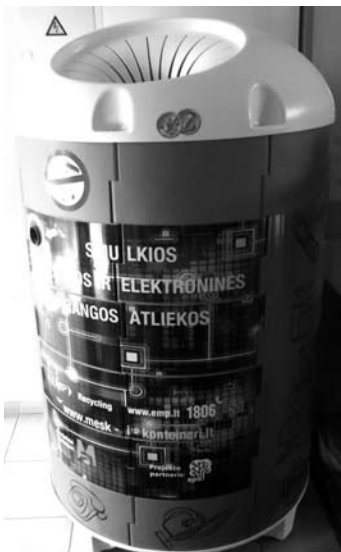
Kiekvienoje Anykščių rajono seniūnijoje yra specialūs Aplinkos ministerijos nupirkti konteineriai įvairiems smulkiems buitiniams elektroniniams prietaisams atsikratyti.