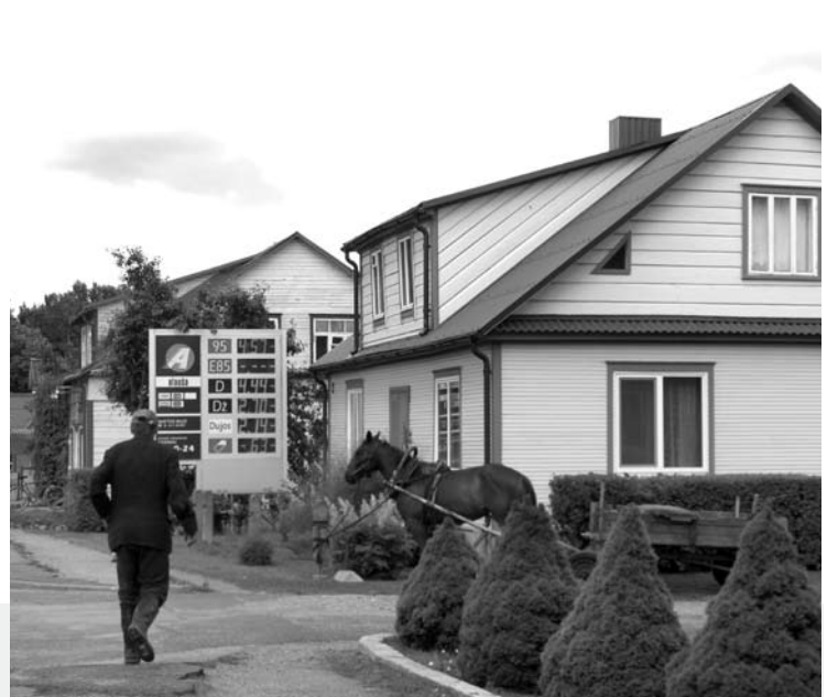
Svėdasai: XIX ir ... XXI amžiaus sandūra...