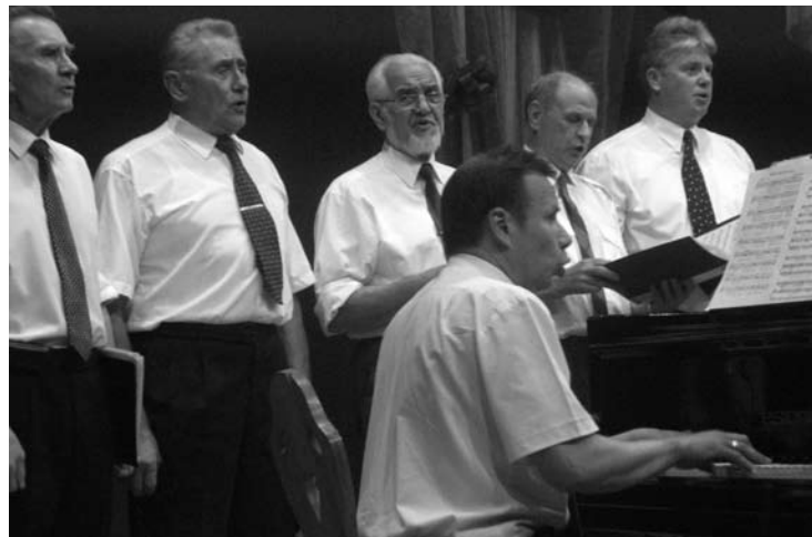
Svėdasų kultūros namų scenoje pakiliai skambėjo choro „Aidas“ vyrų balsai.