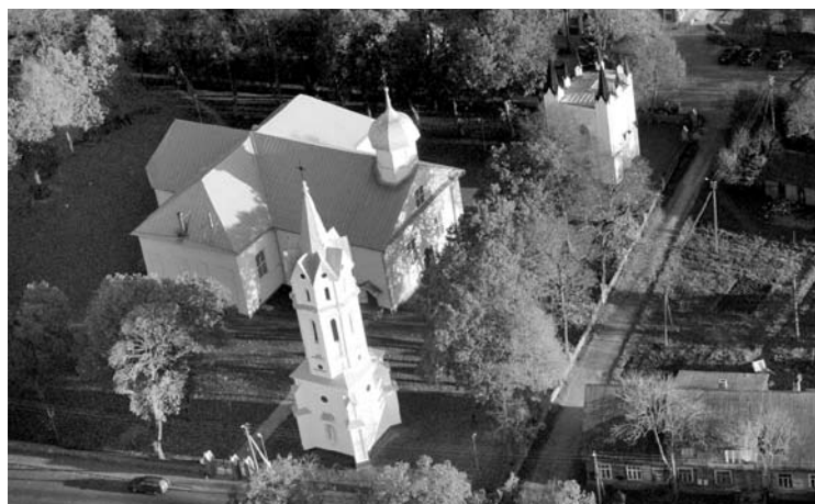
Svėdasuose jau XVI amžiuje buvo katalikų bažnyčia.